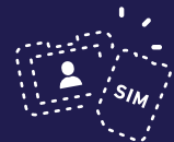
社用 ID など データの紛失・盗難